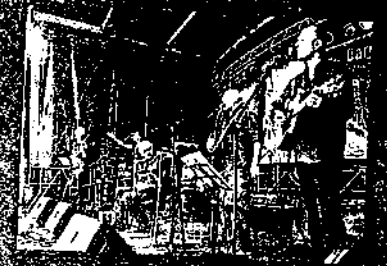
Baraban al Bar de l'ancien Festival, Nürnberg (Germania)